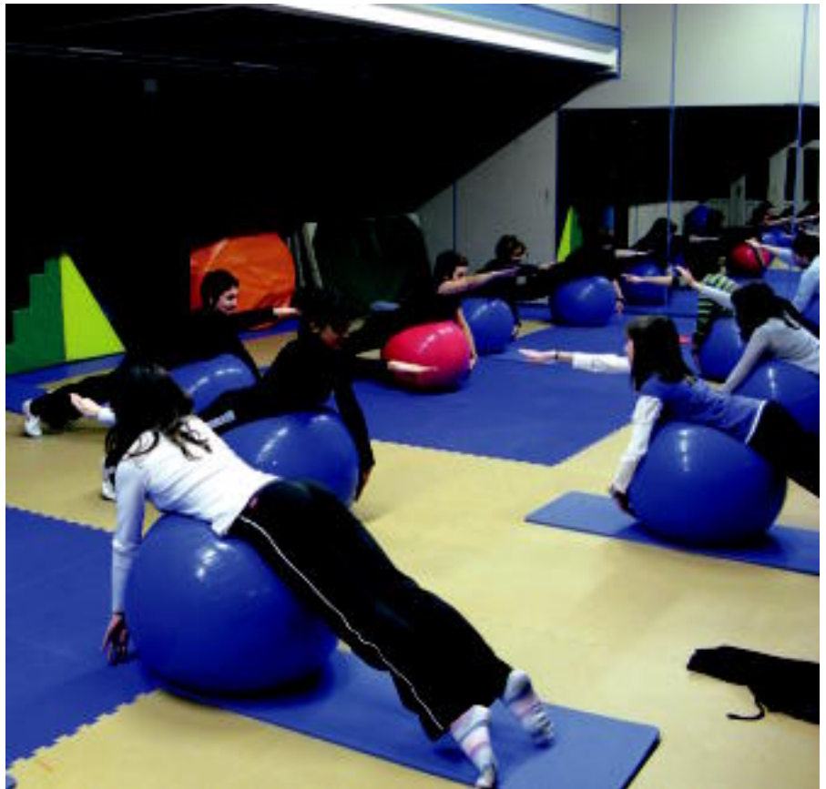
PILATES METODOAREKIN gorputza eta adimena lantzen dira.

Joseph Hubertus Pilates alemaniarrek zehaztu eta garatu zituen gorputza, burua eta izpirituen garapena koordinatzeko mugimendu guztiak. Joan den mendeko 20ko hamarkadan ekin zion bideari, eta egun Pilates izenez ezagutzen dugun metodoari Kontrola izena jarri zion. Hasiera batean dantzariak eta koreografoak interesatu ziren gehienbat, baina pixkanaka-pixkanaka kaleko jendearekin ere hasi zen lanean, errehabilitazio gisa eta malgutasun teknika bezala erabiliz. Azken hamarkadan Pilates metodoa mundu zabalean hedatu da; batik bat, sasoiaren jartzeko, lesioak osatzeko edota modu leun eta atsegin batean entrenatzeko tresna bezala.